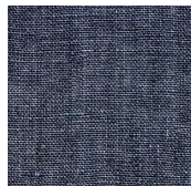
フロートガラス + 高領域UVカット アンフェイド 90 (GF1406)

試験結果 一般透明飛散防止フィルムと比較して、アンフェイド 90は紫外線による著しい変化は見られなかった。