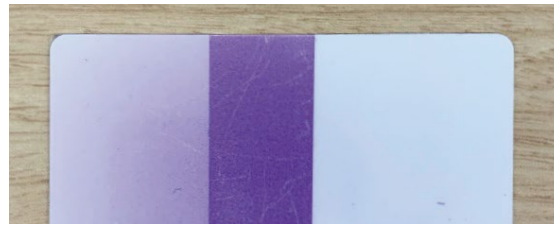
フロートガラス + 一般的な 透明飛散防止 フィルム

強い紫外線を照射すると紫色に変色する特殊なコーティングをしたものに、2種類のフィルムを貼付け、ネイル硬化用の強い紫外線を照射した。