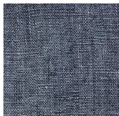
フロートガラス + 一般的な 透明飛散防止 フィルム